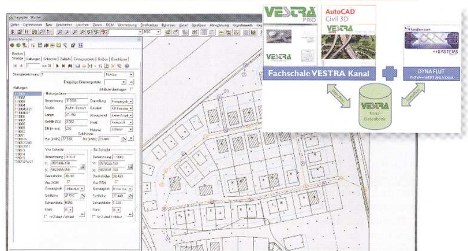
VESTRA PRO mit dem Aufruf der hydrodynamischen Berechnung